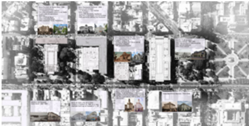
El eje Monteverde.

En este contexto, el Banco Provincia, ubicado en la avenida 7 y las calles 46, 6 y 47 se inserta en este paisaje urbano como un objeto arquitectónico que visibiliza la importancia financiera de la institución en el marco post-fundacional de la ciudad.