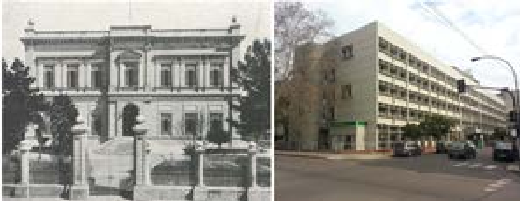
Composición de situaciones de la fachada calle 6. Original y actual. Composición: Arq. María Belén de Grandis.